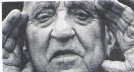
Doing Good (Mannen fra Snåsa)