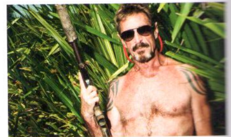
NANETTE BURSTEIN: GRINGO: THE DANGEROUS LIFE OF JOHN MCAFEE Virustorjunnan päivystäväksi dosentiksi itsensä brändännyt John McAfee päätyi it-alan huipulta Belizeen, keräsi ympärilleen rikollisarmeijan ja pakeni lopulta maasta murhasyytteitä. Lähipiiri kutsuu libertaristien presidenttiehdokkaaksikin pyrkinyttä McAfeeta "Belizeen Donald Trumpiksi".