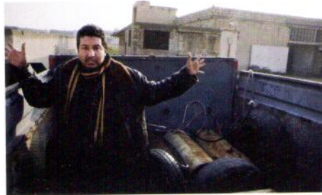
PÅL REFSDAL: DUGMA: THE BUTTON Syyrian sisällissodan eturintamassa Al Qaidan marttyyri-taistelijoita askarruttavat tutut asiat: valokuvat lapsista, Skype-yhteys teknologiaa vieroksuvaan äitiin ja hyvä ruoka. Taustalla lymyää kysymys, josta yksi miehistä uskaltautuu lopulta avautumaan: olenko sittenkään valmis kuolemaan?