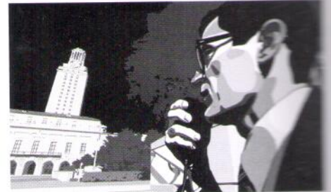
KEITH MAITLAND: TOWER Animaatiota ja arkistokuvaa käyttävä Tower kertoo, mitä Teksasin yliopistolla tapahtui vuonna 1966, kun nuori insinööri kiipesi kellotorniin ja ampui 15 ihmistä. Uutisankkuri Walter Cronkite totesi yhteiskunnan epäonnistuneen, ja sama epäonnistuminen resonoi 2010-luvulla entistä kovemmin.